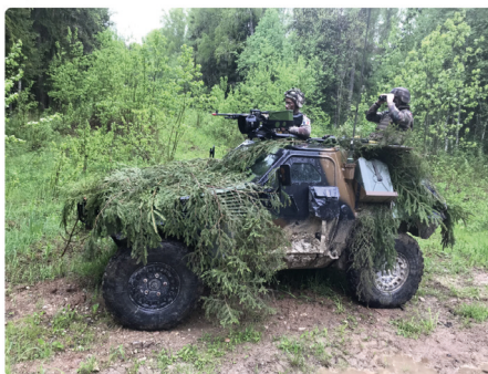
Photo PC prise en Estonie lors d'un déploiement de la 2e BB.

Voici un livre dont la lecture devrait ravir bien des militaires et anciens qui ont côtoyé ce drôle de petit blindé au musée pointu et à la silhouette discrète qui joue pourtant dans la cour des grands. Cet ouvrage, intitulé « VBL PANHARD Devant, Toujours » (132 pages, 30€), retrace l'histoire de ce véhicule devenu légendaire dans de nombreuses unités de l'armée de Terre et plus particulièrement au sein de la Cavalerie blindée.