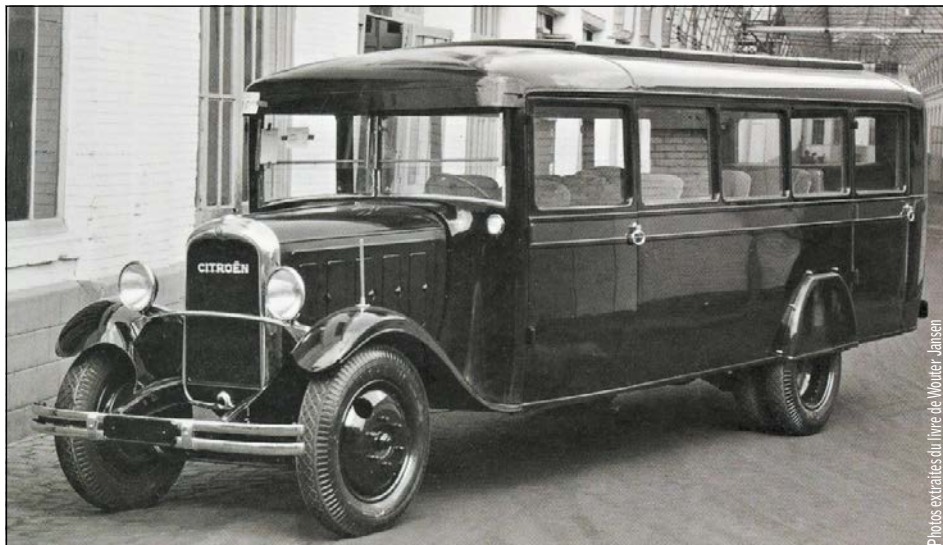
Un autobus C6: la marque aux deux chevrons a construit de nombreux véhicules pour les transports publics. Les Cars postaux suisses ont fait appel eux aussi à des Citroën, notamment aux Grisons.