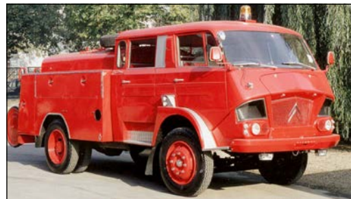
Le 700: il a été dessiné par Flaminio Bertoni, l'auteur des lignes de la Traction, de la 2CV et de la DS.