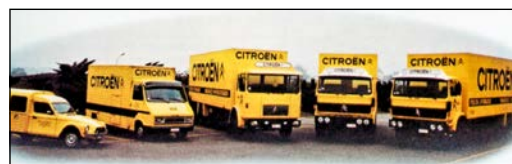
La flotte de l'importateur belge: les deux camions de droite sont des Berliet rebadgés en Citroën.

Citroën n'a pas construit que des voitures. Un très beau livre, écrit par Wouter Jansen, le rappelle juste à temps pour le centenaire de la marque fondée le 20 juin 1919.